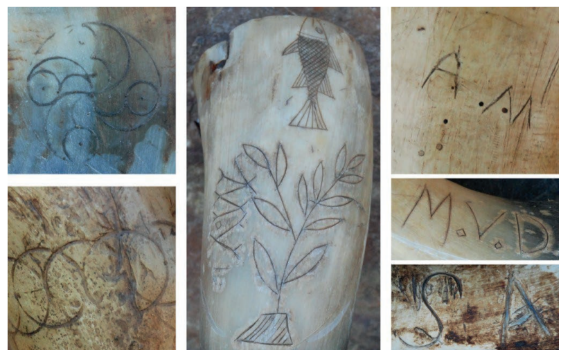
Exemplos de cornos decorados

Os cornos tiñan unha pequena asa que permitía levarlos colgados na cintura. A pedra ía somerxida parcialmente en auga, de modo que sempre se mantiña húmida, garantindo a súa eficacia. O cornu enchíase de herba para evitar folguras e evitar que a pedra golpeará as paredes do recipiente. Moitos cornos decorábanse ou marcábanse como signo de propiedade.